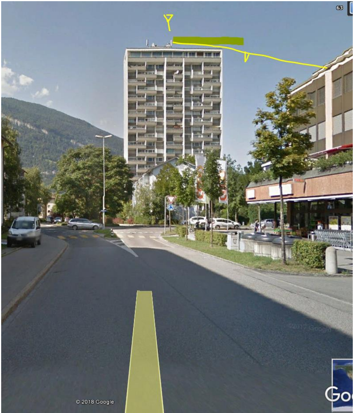
Sender Hochhaus deckt diese Strecke ab.