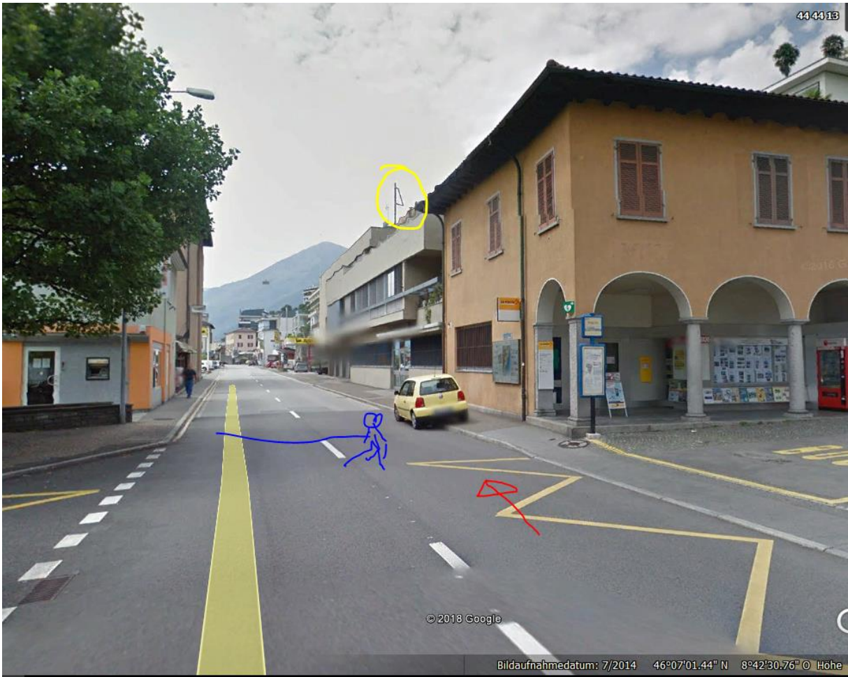
alter Funkstandort auf dem nächsten Haus, aktuell vermutlich nicht in Betrieb