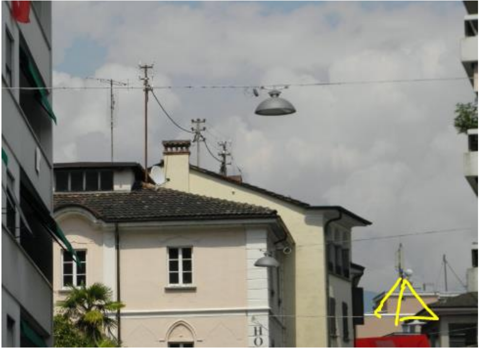
Der Sender bestrahlt die Hauptstrasse, Zusätzliche Reflexionen an Gebäuden. Fahrzeugtyp nicht bekannt, aber Senderlage zum Unfallstandort hoch / downtilt, d.h. Einstrahlung auch bei geneigter Heckscheibe gross.