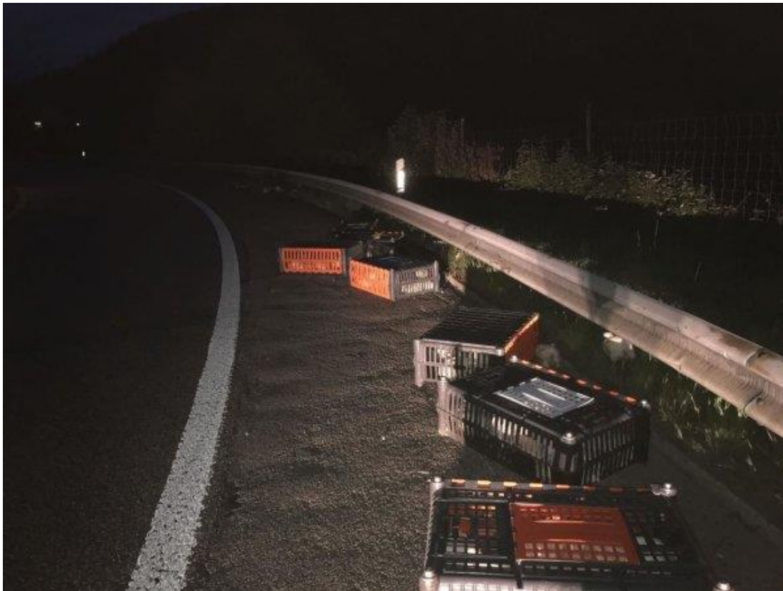
Ladung nicht genügend gesichert, aber offensichtlich auch sehr schnell unterwegs.