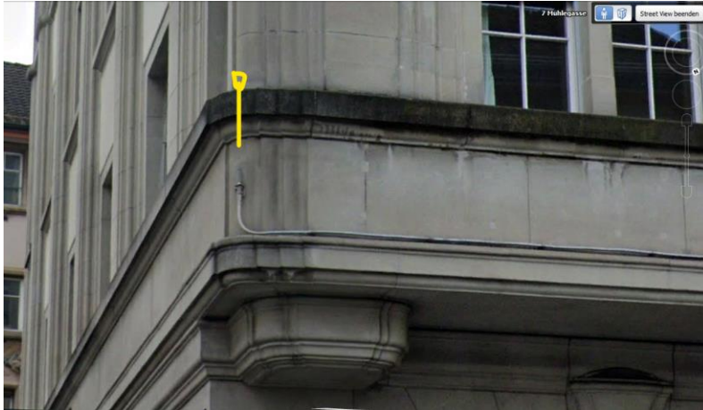
Kleinsender auf 4 m Höhe

Eine lokale Messung erfolgte am 29.12.24, 15:15m mit HF 59 B, (bis 2400 mHz)