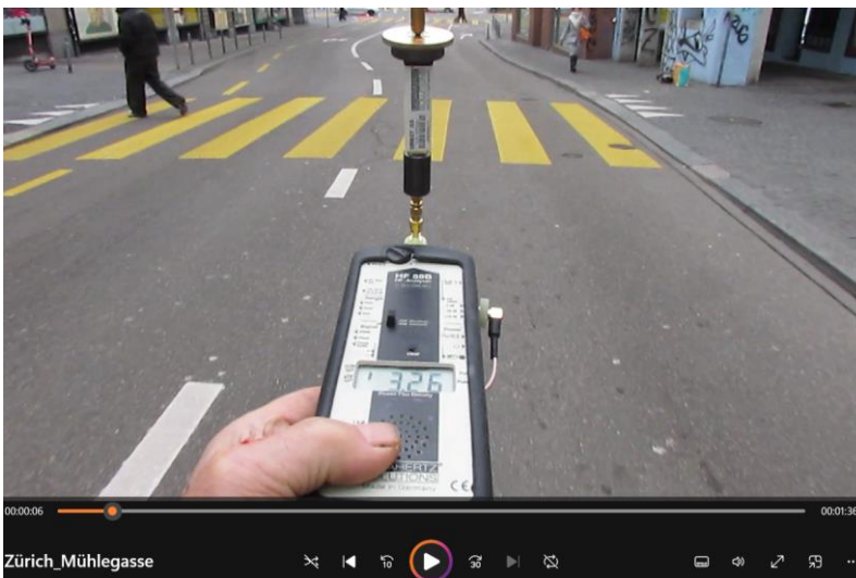
10m vor dem Streifen

Eine lokale Messung erfolgte am 29.12.24, 15:15m mit HF 59 B, (bis 2400 mHz)