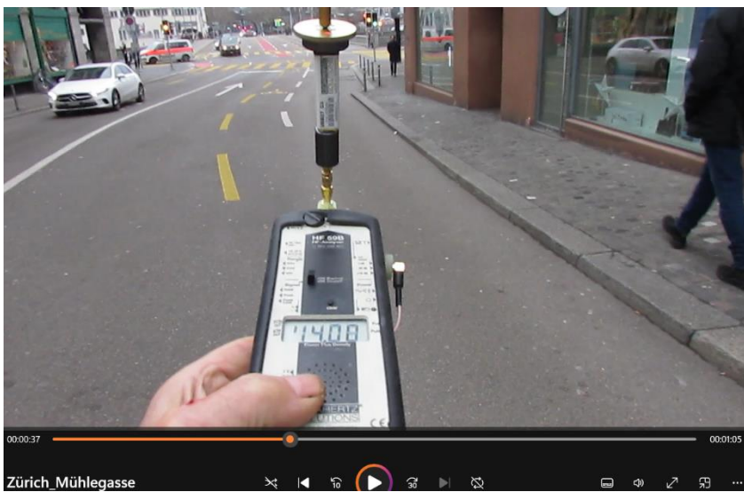
Hier maximale Belastung ungefähr am Ort des Trottoir-Befahrens.