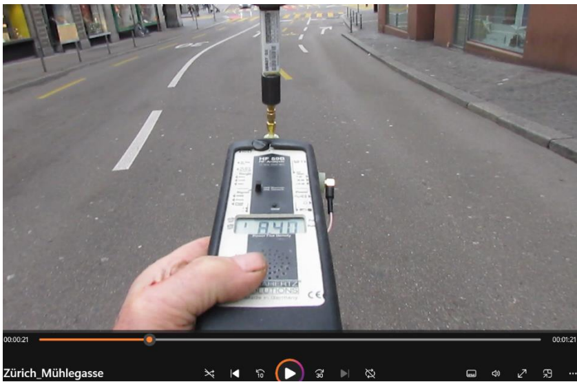
1 m nach dem Fussgängerstreifen